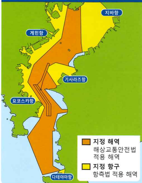
정보 청취 의무 해역

비상재해 시에는 해상보안청이 선박의 안전한 항행을 지원하기 위해 제공하는 비상재해 등에 관한 정보를 각 선박은 청취해야 합니다.