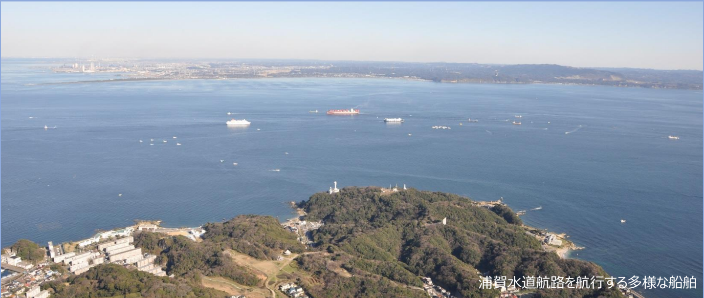
浦賀水道航路を航行する多様な船舶