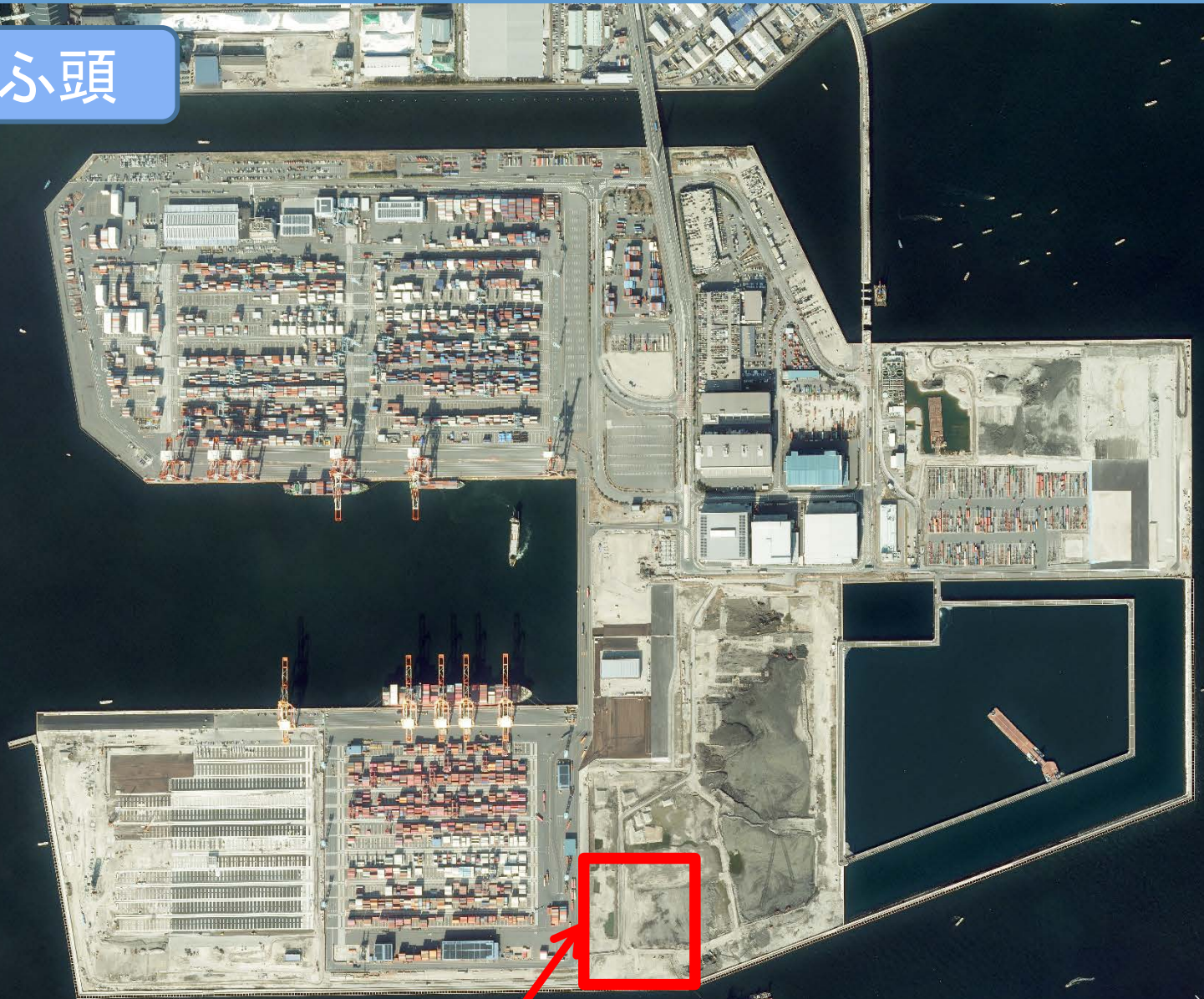
南本牧埋立工事・第5-1ブロック載荷盛土工事（その3）